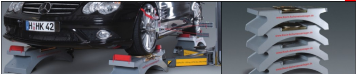
Mesure à l'aide d'un pont 2 colonnes avec les pieds optionel de géométri à plaques tournante intégrés Meting met behulp van een 2-palenbrug in combinatie met de optionele uitlijnsteunen met geïntegreerde platen