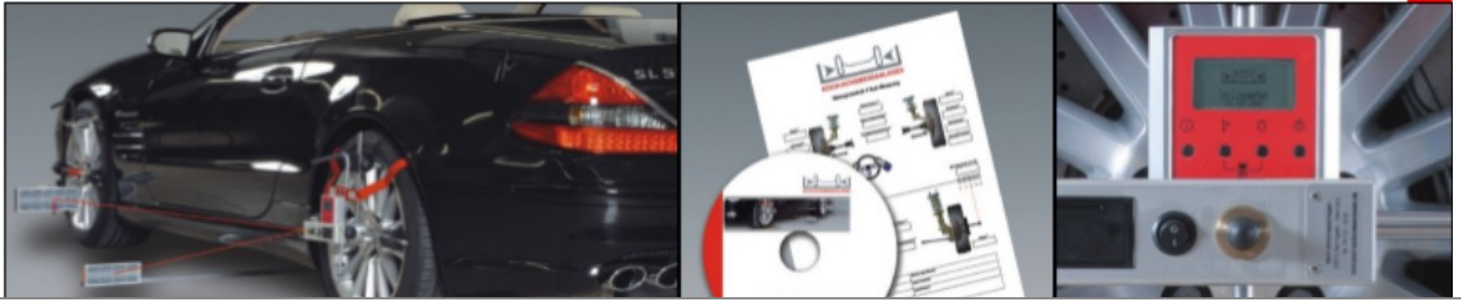
Mesure de l'axe arrière – Programme d'assistance et possibilité d'imprimer – Inclinomètre digitale avec assistance Achterasmeting – Assistentieprogramma en printen rapport – Digitale hoekmeter met assistentie